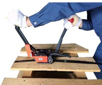
④ 帯鉄のシーリングと切断