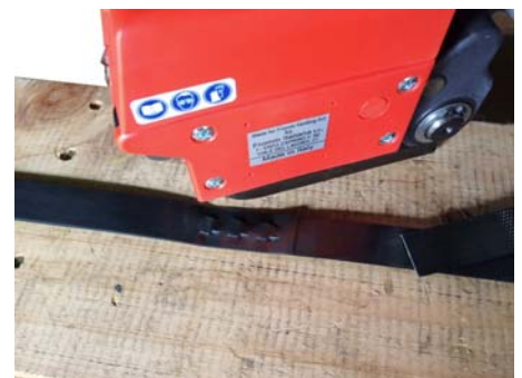
⑥ 帯鉄のシーリング状態