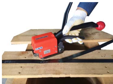
⑤ シールレス結束の完了