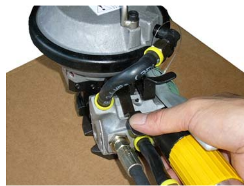
左レバーで封緘と切断