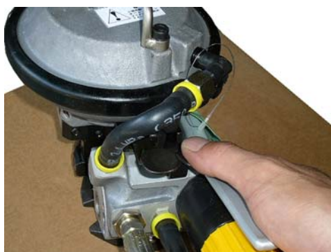
右レバーを押すと引締め