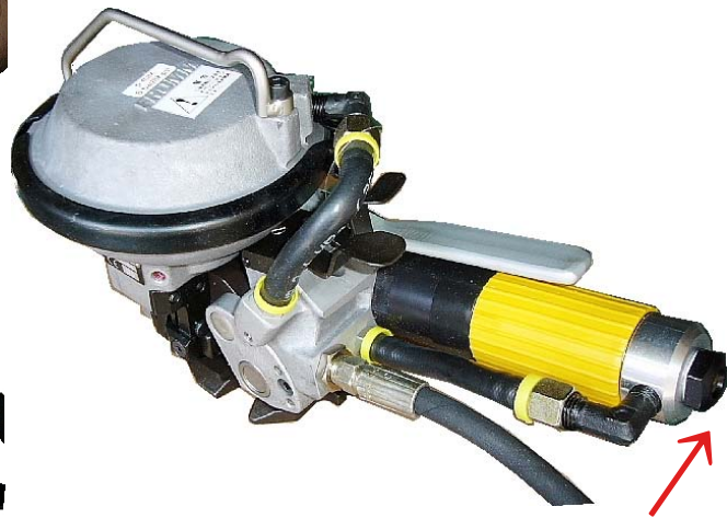
引締め力調整スクリュー