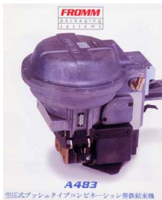
A483 空圧式プッシャタイプコンビネーション帯鉄結束機